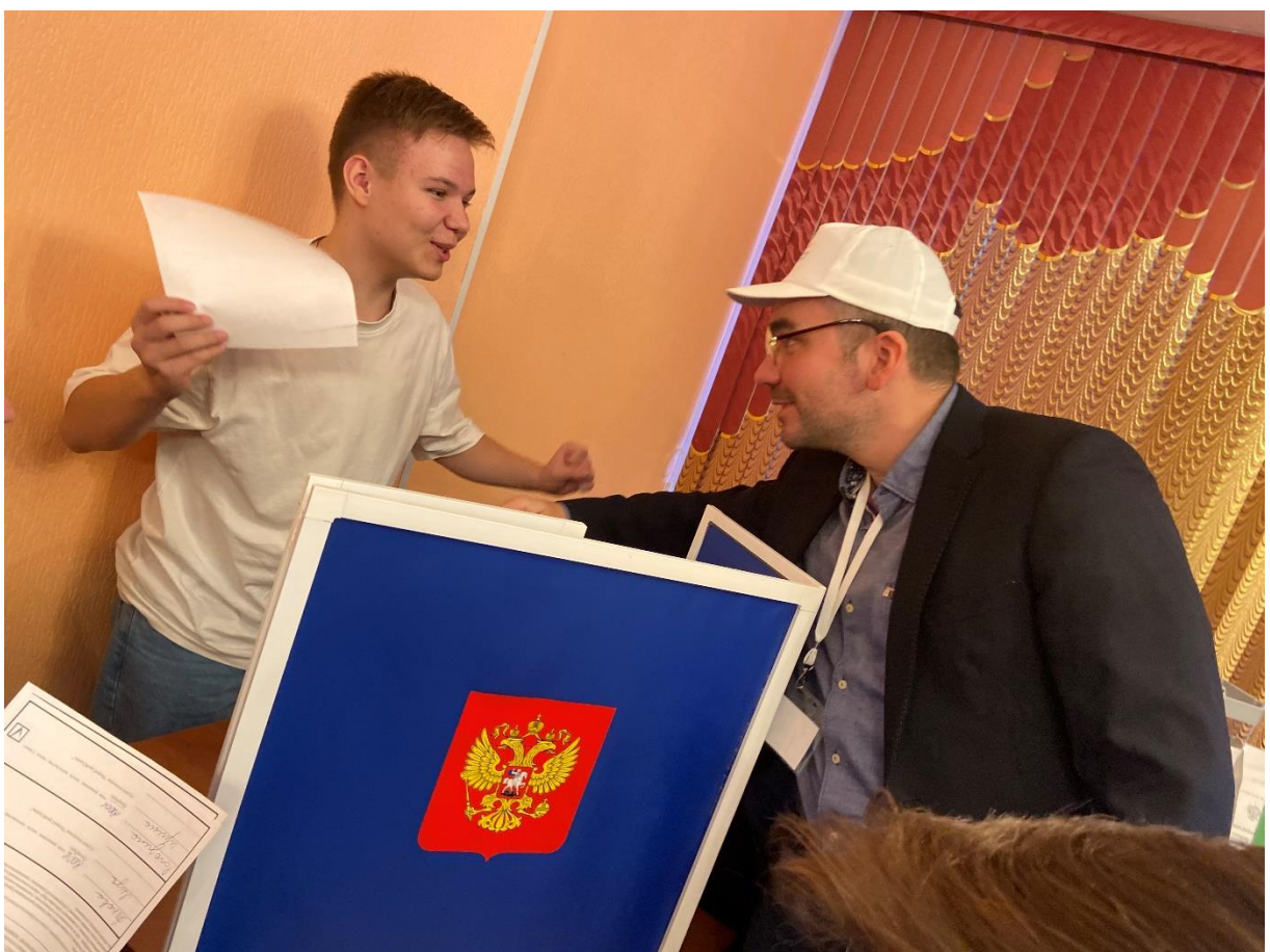
Голосование сопровождалось общественным наблюдением